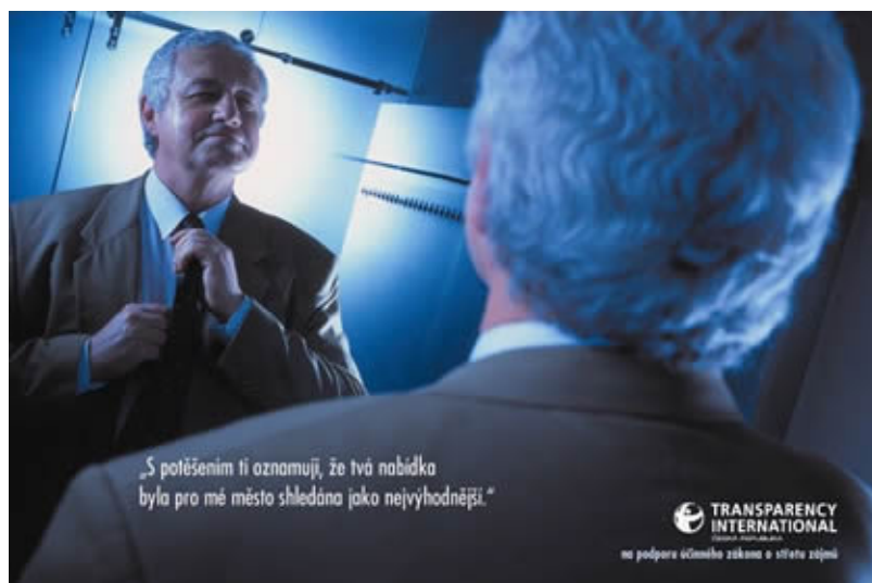
Mediální kampaň TIC

TIC na podporu přijetí účinného zákona o střetu zájmů v letech 2004-5 uskutečnila mediální kampaň.